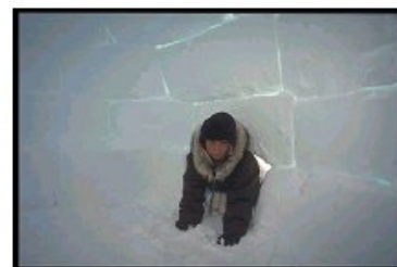
Εικόνα 6. Απόσπασμα από την ενότητα Γ' του φυλλαδίου εργασίας για το μαθητή και τη μαθήτριά

Στην ίδια ενότητα δραστηριοτήτων, τα παιδιά επιλέγουν δύο διαφορετικές περιοχές της Ελλάδας, όπου επικρατούν διαφορετικά καιρικά φαινόμενα και συζητούν για το πώς ο καιρός σε καθεμία από αυτές επηρεάζει την κατασκευή των κατοικιών (στο σημείο αυτό μπορεί να γίνει αναφορά και στον τρόπο ζωής των κατοίκων σε κάθε περιοχή).