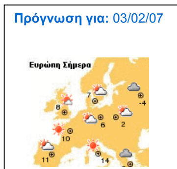
Εικόνα 5. Ο χάρτης της Ευρώπης από την ιστοσελίδα της Ε.Μ.Υ. με την πρόγνωση του καιρού για την 3/2/2007

δ) Η επίδραση των καιρικών φαινομένων στη ζωή των ανθρώπων μιας περιοχής