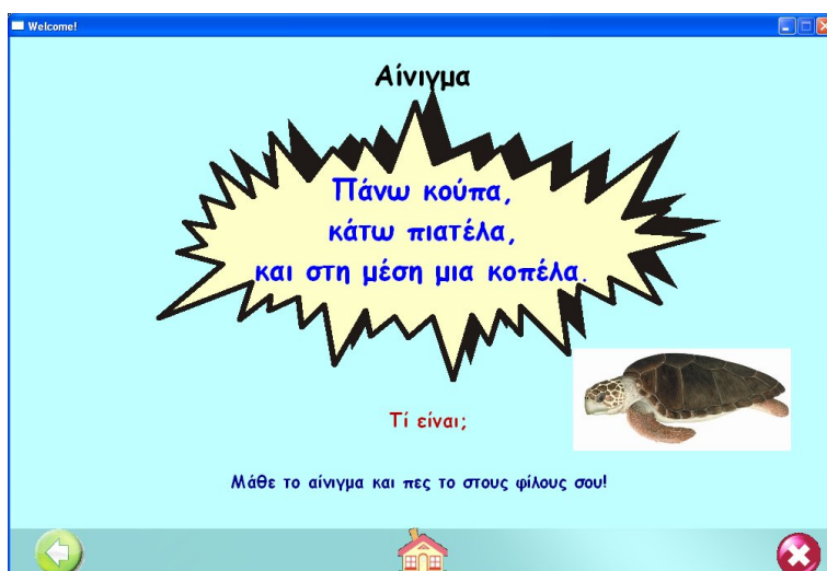
Εικόνα 2: Παιχνίδι Αινίγματα, από την ενότητα Χελώνα.

Σε κάθε θεματική ενότητα διακρίνονται δυο υποενότητες δραστηριοτήτων με διαδραστική μορφή, οι οποίες αποτελούν εργαλεία για δημιουργία, εκμάθηση, εξάσκηση ή εμπέδωση των αντικειμένων γλωσσικής διδασκαλίας. Πιο συγκεκριμένα, στην πρώτη υποενότητα, «Διαβάζω με το Ντίνο», δίνεται η δυνατότητα στο παιδί να αποκτήσει πληροφορίες για το κάθε ζώακι, όπως το πού ζει, με τί τρέφεται και για ποιους λόγους κινδυνεύει να εξαφανιστεί. Παράλληλα, μπορεί να ακούσει τη φωνή του και να παρακολουθήσει ένα ολιγόλεπτο βίντεο με το ζώο στο φυσικό του περιβάλλον. Επίσης, υπάρχουν εικονίδια που δίνουν τη δυνατότητα στο παιδί να επιλέξει μεταξύ των δραστηριοτήτων: α) Αινίγματα, β) Παροιμίες, γ) Τραγούδια, δ) Μύθοι Αισώπου, παραμύθια και ποιήματα (Εικόνα 2).