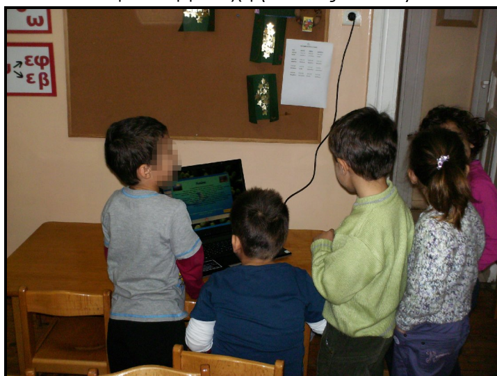
Εικόνα 4: Τα παιδιά συζητούν μπροστά στον υπολογιστή.

Την τρίτη μέρα, τα παιδιά είχαν τη δυνατότητα να ξανασχοληθούν με το λογισμικό. Σε κάθε ομάδα όμως έγινε αλλαγή του χρήστη του ποντικιού, έτσι ώστε να δοθεί η ευκαιρία σε όλα τα παιδιά να επιλέξουν και να πραγματοποιήσουν δραστηριότητες. Μόλις ολοκλήρωσαν τη διαδικασία όλες οι ομάδες, έγιναν ερωτήσεις στα παιδιά για τις συνολικές εντυπώσεις τους, τι τους άρεσε περισσότερο και τι δεν τους άρεσε καθόλου. Στόχος ήταν να διαπιστωθεί η επίδραση του λογισμικού και των δραστηριοτήτων ειδικότερα, στο κίνητρο των παιδιών για συμμετοχή (Εικόνες 4 και 5).