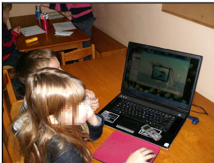
Εικόνα 5: Τα παιδιά πραγματοποιούν τις δραστηριότητες σε ομάδες (δυάδες).