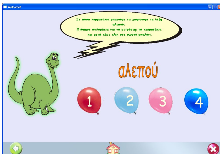
Εικόνα 3: Παιχνίδι Μετράω τις συλλαβές από την ενότητα Αλεπού

Η δεύτερη υποενότητα, «Παιχνίδια», περιλαμβάνει τέσσερα είδη δραστηριοτήτων: α) Μετράω τις συλλαβές : Τα παιδιά μετρούν τις συλλαβές των λέξεων χτυπώντας παλαμάκια (Εικόνα 3), β) Οι συλλαβές μπερδεύτηκαν : Τα παιδιά τοποθετούν στη σειρά τις μπερδεμένες συλλαβές με την τεχνική «σύρε και άφησε», γ) Βρίσκω πώς λένε το ζώακι : Τα παιδιά επιλέγουν από μια λίστα το όνομα του ζώου που βλέπουν στην οθόνη, δ) Βρίσκω τα αντικείμενα που το όνομά τους αρχίζει από την ίδια φωνούλα : Τα παιδιά αναγνωρίζουν τις λέξεις που αρχίζουν από το ίδιο φώνημα. Η τελευταία είναι για δραστηριότητα μεταφωνολογικής ενημερότητας για τις σχέσεις ήχου-συμβόλου, για την ανάγνωση (Κουτσουβάνου, 2006).