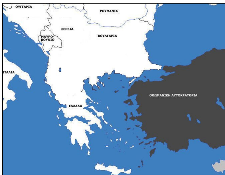
Εικόνα 4: Σχεδίασε τα σύνορα της Ελλάδας και των γειτονικών της κρατών μετά το τέλος των Βαλκανικών Πολέμων.