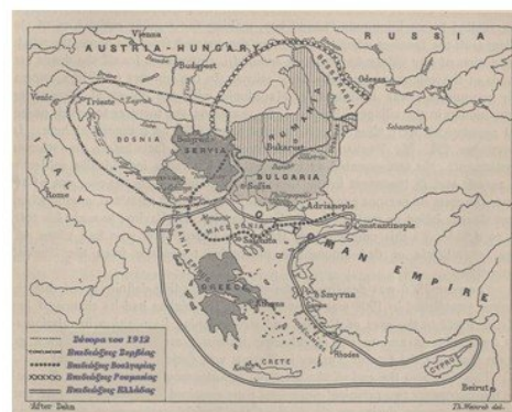
Εικόνα 2: Οι εδαφικές βλέψεις των λαών της Βαλκανικής χερσονήσου

• Η Ελλάδα βλέποντας τα σύννεφα του πολέμου εξοπλίζεται. Το 1909 ξεσπά η επανάσταση στο Γουδί. Ποια τα αιτήματά της και τι άλλο έκανε που είχε μεγάλη μετέπειτα σημασία;