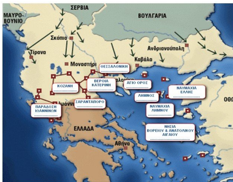
Εικόνα 3: Οι κυριότερες μάχες που έδωσε ο ελληνικός στρατός και στόλος κατά τη διάρκεια του Α' Βαλκανικού πολέμου.