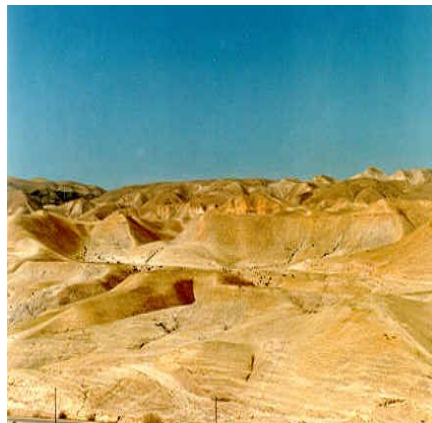
Εικόνα 1: Η έρημος της Ιουδαίας