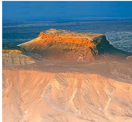
Εικόνα 2: Το φρούριο της Μασάντα