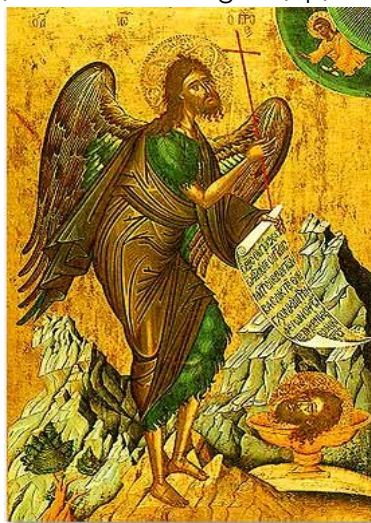
Εικόνα 5: Βυζαντινή εικόνα που απεικονίζει τον Ιωάννη το Βαπτιστή (πηγή: http://www.atmajyoti.org/ch_aquarian_commentary_13.asp )

ancienthistory.about.com/od/monotheisticreligions/tp/032808BiblePeople.htm )