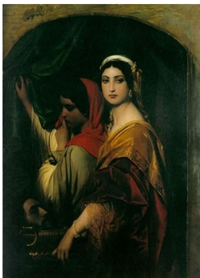
Εικόνα 4: Η Ηρωδιάδα και η κόρη της. Πίνακας του Paul Delaroche (Πηγή:

Στο Power Point θα παρουσιαστούν πίνακας ζωγραφικής με το γνωστό χορό της Σαλώμης και η βυζαντινή εικόνα με την αποτομή της κεφαλής του Προδρόμου.