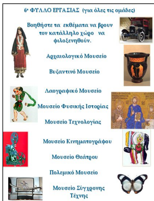
Εικόνα 5: Το 6ο φύλλο εργασίας (για όλες τις ομάδες)

Η αξιολόγηση γίνεται με το 6 ο φύλλο εργασίας, το οποίο είναι κοινό για όλες τις ομάδες. Στο φύλλο αυτό οι μαθητές πρέπει «να βοηθήσουν τα εκθέματα που τους δίνονται να βρουν σε ποιο μουσείο θα φιλοξενηθούν».